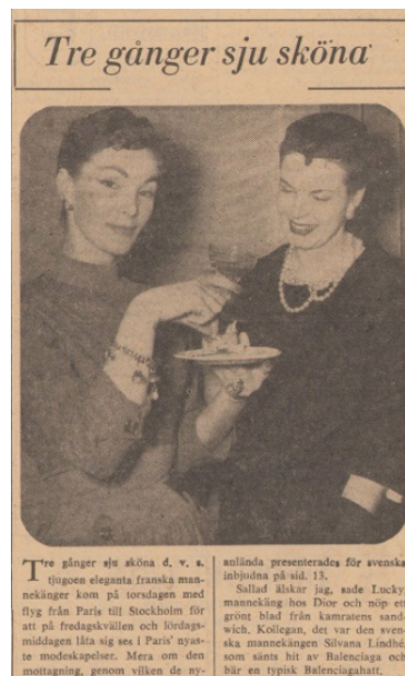
Svenska Dagbladet 25/3 1955