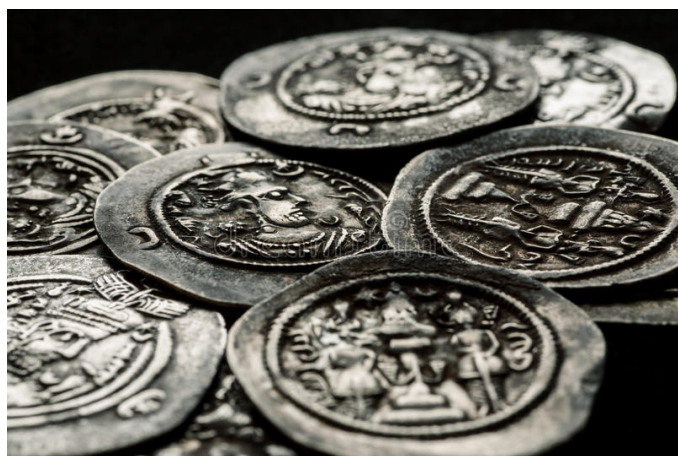
Persiska äldre silvermynt.

Här liksom i D. – och som det lär vara hela vägen ner till Shiraz – vägra folket att mottaga silfvermynt af äldre datum, ehuru officiellt fullt gångbart mynt och af t.o.m. bättre silfverhalt än de nya mynten. Förbannade drumlar på banken i Isfahan som lämnade sådana pengar då de kände förhållandena! - Dagsmarsch 36 km.