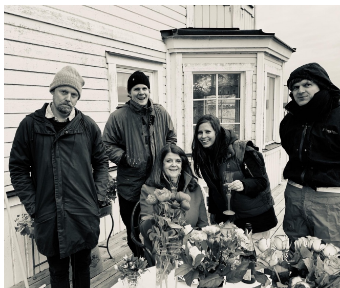
Bilden tagen på själva födelsedagen i april, ett kylslaget Corona-anpassat firande.